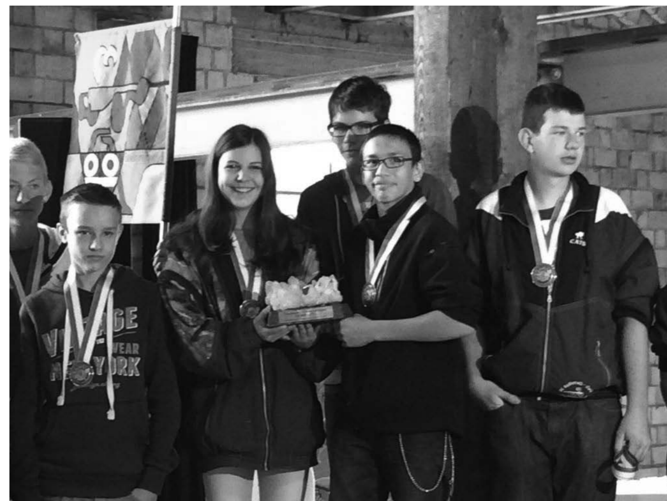
(Die strahlenden Sieger aus Hagenbuch am OGWJJ)