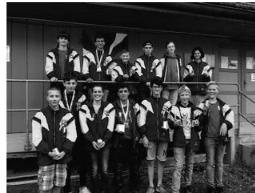
Die Mitglieder vom erfolgreichen Kurs aus Rickenbach